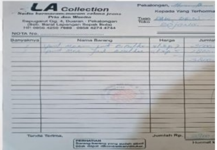
Foto : Seorang Pria Berinisial S (35) Warga Kelurahan Banyuurip, Kecamatan Pekalongan Selatan, Kota Pekalongan, Jawa Tengah Dilaporkan ke Pihak Kepolisian Polres Pekalongan_ Polda Jateng.